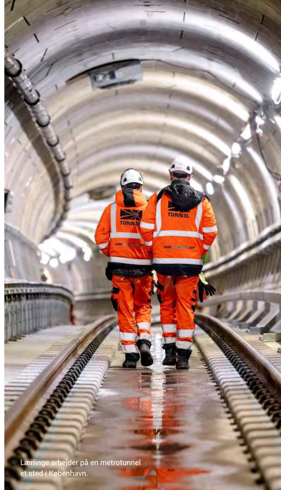
Lærlinge arbejder på en metrotunnel et sted i København.

Hovedstadens Letbane tog desuden i 2019 første spadestik til den nye letbane langs Ring 3. I den endelig udbudskontrakt lå der krav til entreprenøren om at levere 58 lærlingeårsværk på det samlede byggeri. Med Byggherforeningens lærlingeindsats kunne Letbanen støtte entreprenører og underentreprenører i forhold til at nå deres måltal for lærlinge, der var fastsat i kontrakten.